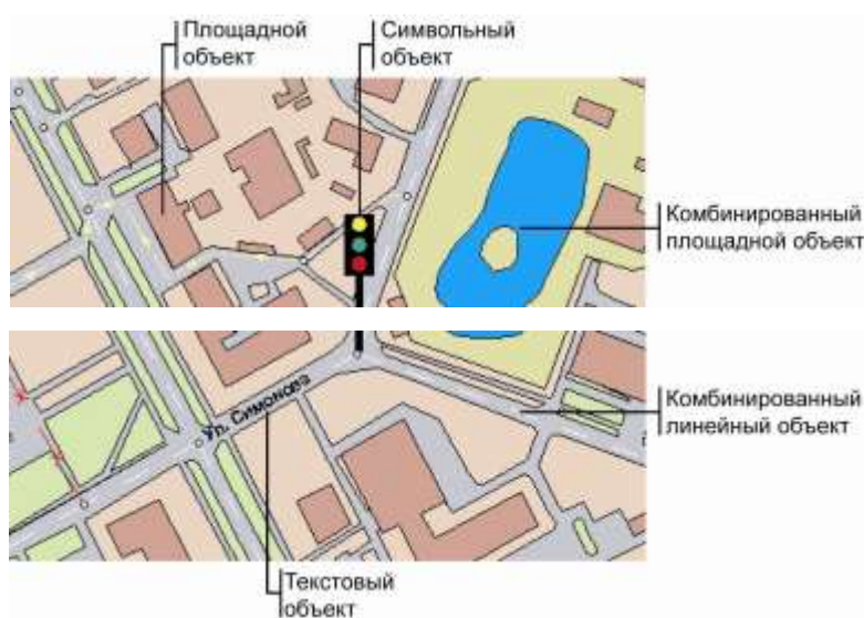
Рисунок 8.5. Примеры объектов

Текстовый объект описывается текстовой строкой, координатами точки привязки левого нижнего угла прямоугольника, в который вписан текст, углом поворота, высотой шрифта (в сантиметрах на местности). Объект может отображаться заданным цветом и стилем шрифта. Так как высота текста описана в сантиметрах на местности, то текст масштабируется в соответствии с масштабом окна карты.